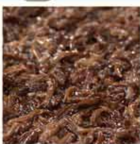
木耳水煮スライス